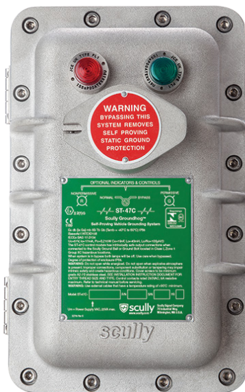
Sistema de Verificação de Aterramento Estático – Groundhog

Com Dynacheck® – Circuito de Auto Verificação Automático e Contínuo