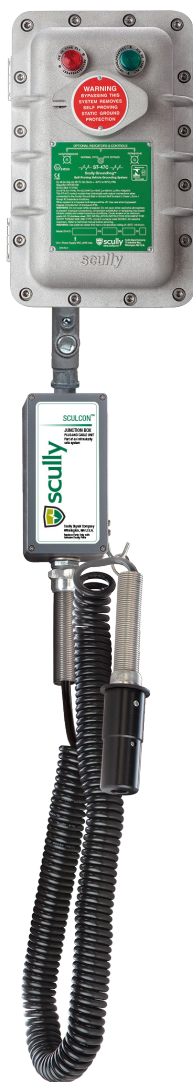
Monitor de Controle Scully Groundhog com Plugue e Cabo