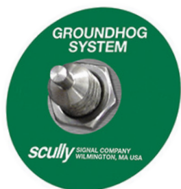
Parafuso (Bolt) Eletrônico Scully de Aterramento Estático