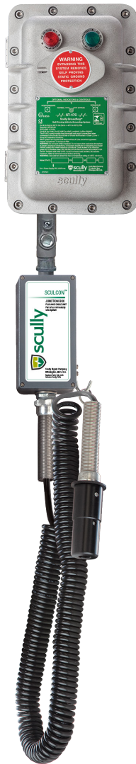
Monitor de Control Scully ST-47C con Enchufe y Cable