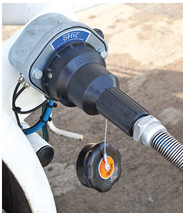
Una Conexión para la Prevención de Rebosamiento y Puesta a Tierra