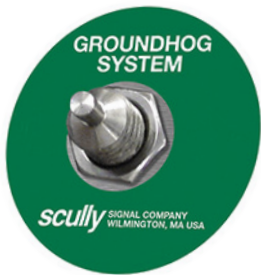
Scully Tornillo de Tierra