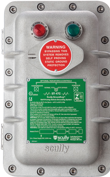
Sistema de Verificación de Puesta a Tierra Estática

Con Dynacheck® – Circuito de Autoverificación Automática y Continua