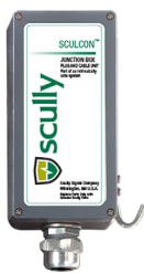
Caixa de Junção Sculcon

Para uma Conexão Segura e Confiável do Rack de Carregamento ao Veículo