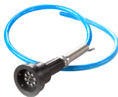
Plugue Poly & Cabo