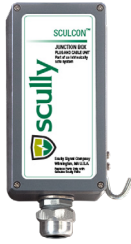
Caja de Conexiones Sculcon